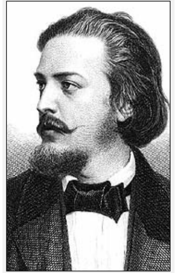
Paul Von Heyse

Señor Jeohvá, KLM, Señor Mío: sin corazón, o con mi poco corazón: endurecido, pero arrodillado y suplicante, imploro: Detén este dolor que me quema la piel y la garganta. Ten piedad de mí; concédeme tu misericordia y haz que venga finalmente tu Reino. Amén.